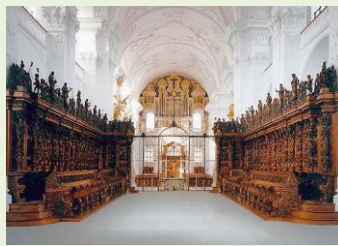
Das Chorgestühl mit Chorgitter, eine internationale Sehenswürdigkeit