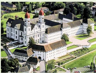
Ehemaliges Kloster St. Urban